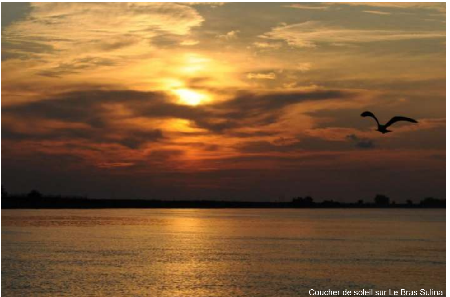
Coucher de soleil sur Le Bras Sulina