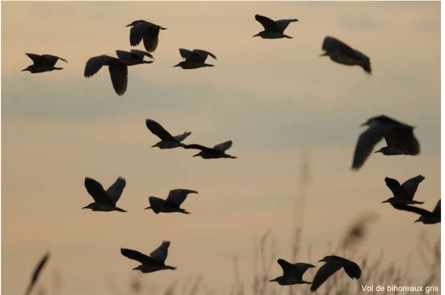
Vol de bihoreaux gris